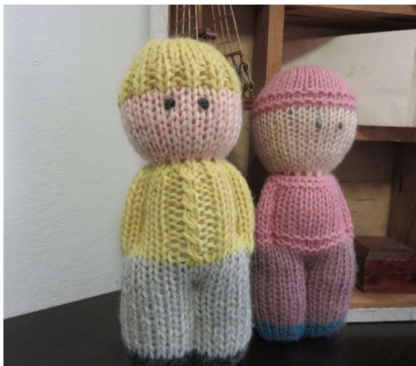
IL BANDOLO DELLA MATASSA