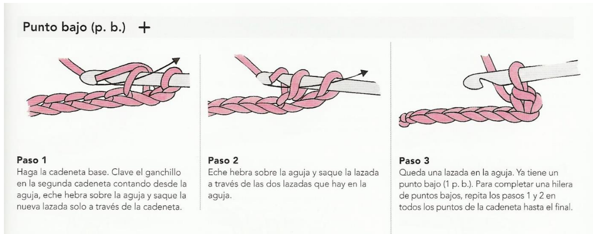
Imagen extraída del libro "Manual de Ganchillo" de Sarah Hazell